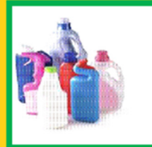
Les pots, boîtes, barquettes, sacs, sachets, films, bouteilles et flacons plastiques